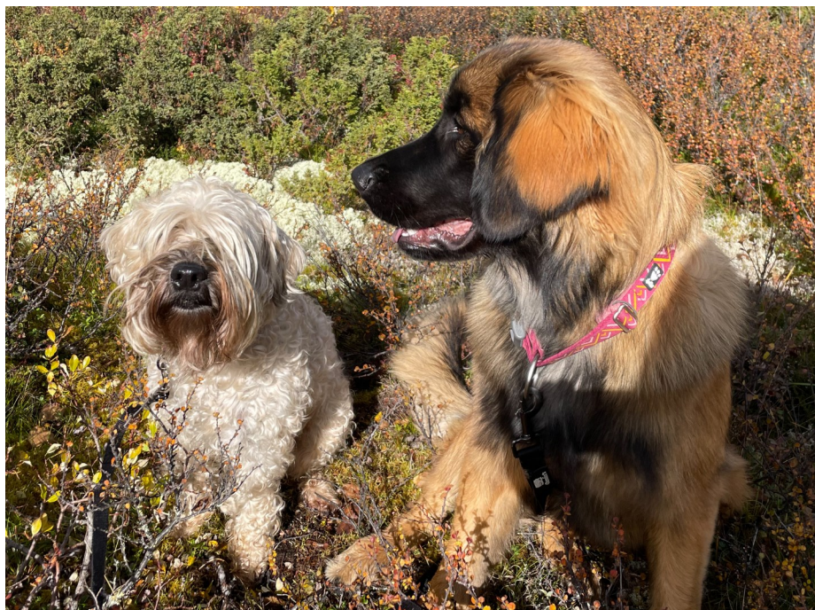
Mig Freja og min ven Lotus

Her sidder jeg og venter på min plageånd.