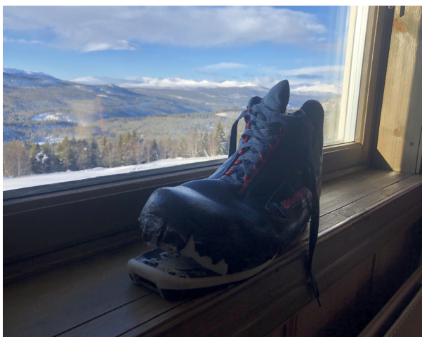
En sørgelig støvle

føre og dels begyndte det at blæse op, da vi stak hovedet op på højfjeldet. Snescotersporet var ikke til at se, og man kunne kun orientere sig via afmærkningskvistene. Sneen føj og vinden gik gennem handskerne, så fingrene snart blev følelseløse. Mobiltelefonen kunne heller ikke lide kulden og skærmen frøs. Da vi nåede løjpens højeste punkt ser vi en hytte længere nede ved en sø – det må da være Megrundsbuga! Vi trængte til at komme i læ, så vi tog en genvej nedover en skrånning, hvor sneen dog var meget skarret!. Pludselig besluttede min ene skistøvle sig for, at nu ville den på pension.....Limningen mellem sål og støvle gik simpelthen op, hvilket resulterede i et kæmpe styrt. Skiløb blev nu væsentlig mere besværligt. Men pyt, vi kunne jo sætte os ind i hytten og få varmen....men ak, det viste sig at det