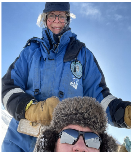
På ferie på Svalbard

weekend, da vi hadde gjester som kom oppover fra Lillehammer og omegn, og det var så mye snø at de hadde problemer med å komme seg frem. En opplevelse det også.