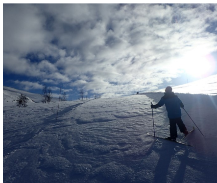
På ski helt derop