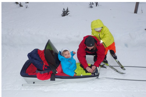
På vej til Bingsbu