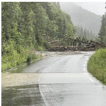
Hans har spærret veien

Vi hadde store forventninger til august, visste at ok, vi har fulle hus under Peer Gynt Kulturfestival. Og to tyske grupper i tillegg til et par gode selskaper, så det skulle bli godt. Peer Gynt startet 3.august og varte til 13.august. Personalet var til Generalprøve den 3. og kom begeistret hjem. Ganske godt vær også, kun litt regn før forestillingen startet. Vi fikk huset fullt av glade gjester og gikk i gang med den travleste tiden på sommeren, med middag to ganger pr. dag og nattmat, og skifte av gjester nesten hver dag. Lørdag 5.august ble en flott dag, sol hele dagen og forestillingen om aftenen ble den beste i år.