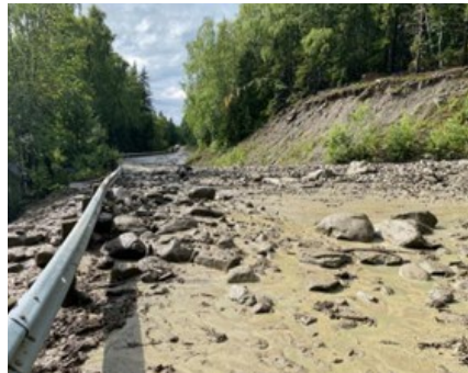
Vej i Skåbu

så der blev lidt stille i bilen. Måske kunne vi leje en hytte på campingpladsen .. Øh uden toilet i øsende regnvejr. Nej Tak. Heldigvis var der så Skåbu Fjellhotel, der var åbent. De havde lige 2 værelser til os. Intet er så galt at pilselv rejser, en god lokal øl og Elgsuppe ikke kunne rette op på en udfordrende dag. Det var meget lækkert, men også en lidt dyr løsning, for nu var ALT lukket, og vi kunne ikke se, hvornår det blev muligt at komme hverken frem eller tilbage.