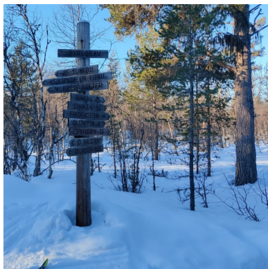
Det forvirrende skilt