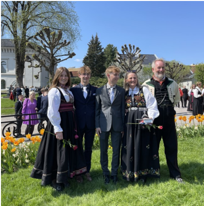
En norsk konfirmation

Vi fikk oss også noen flotte skiturer i slutten av april, og starten av mai. Vi gledet oss til vår årlige Danmarkstur. Det må jeg si var deilig etter en lang vinter, endelig møte våren i deilige Danmark. Det ble en veldig kort tur, men vi merket solen og bøgen var akkurat sprunget ut, derfor følte vi foråret sterkt.