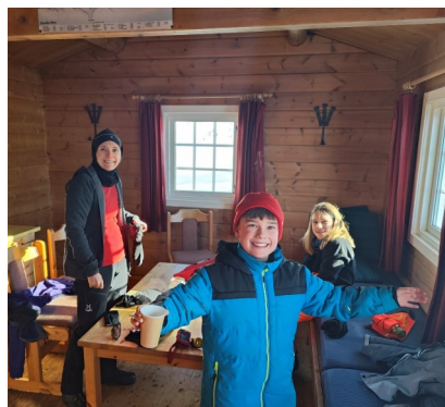
På Bingsbu med familien