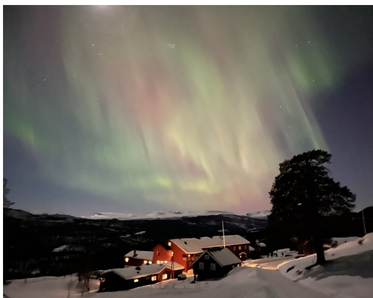
Nordlys over fjeldstuen