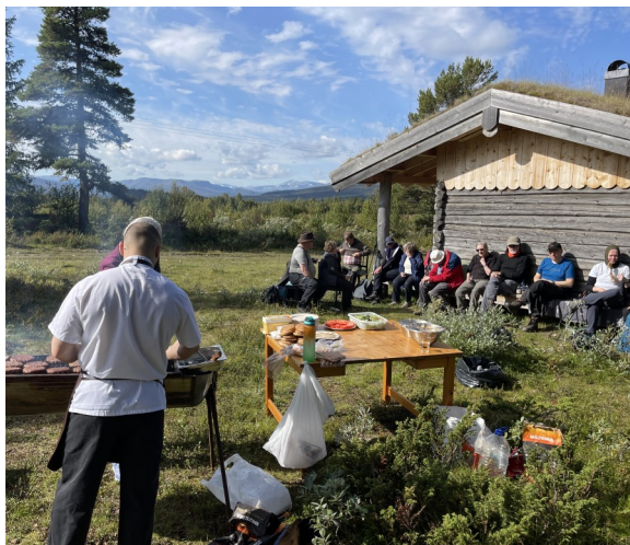
Lækker grill-mad ved Huldrebu

åbnede), før det gik opover igen, var vi nede at kigge til Espefossen. Det var en tur i et behageligt tempo krydret med information om den lokale flora, og hvordan man i tidernes morgen jagtede elge.