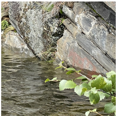
Vandet når Hellemaleriesne

det gikk et skred på hver side av gården deres. Fylkesvei 255 var lukket i 14 dager, før vi kunne kjøre dere igjen, og de arbeider fortsatt på to steder på den veien.