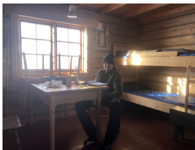
Den rigtige hytte

Tanken om, at fjeldet havde besejret os nagede os i et helt år. Så I kan nok forstå, at drømmen om at nå Megrundsbua stod højt på ønskelisten i 2023. Der var væsentlig mere sne i fjeldet dette år og solen skinnede fra en skyfri himmel og ikke en vind rørte sig. Så med nye skistøvler, madpakker, gaffatape og fjeldkort i tasken skulle fjeldet besejres. Denne gang var planen, at gå op fra Espedalen via Venliseter og hjem samme vej. Snescootersporet var tresporet, så det var næsten en motorvej. Turen var utrolig smuk og med jakkerne om livet og solbriller besteg vi højfjeldet og fandt uden større besvær hytten, hvor vi spiste den medbragte frokost. Turen kan helt klart anbefales i godt vejr.