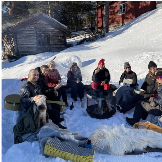
Rutens personale griller