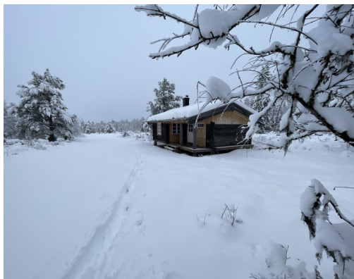
Hulderbu i vinterdragt