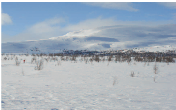
Storslået natur og sne! (Året er 2008)

Det særlige ved Ruten Fjellstue er den storslåede natur og sneen - når den er der - og solen - når den er der - det er alle de dejlige mennesker, vi skal være sammen med - det er den gode