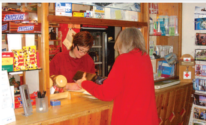
Regnskabets time er inde!

Vi er sikre på, at der er nedlagt nogle små ”langrendsfør” i næste generation.