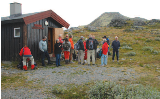
Bingsbu - et herligt gensyn!

Vejret var fint - ikke meget sol og noget køligt, men det var tørt. Vi travede godt til, målet var Lohaugen, hvor vi skulle spise lunch. Nogle tog