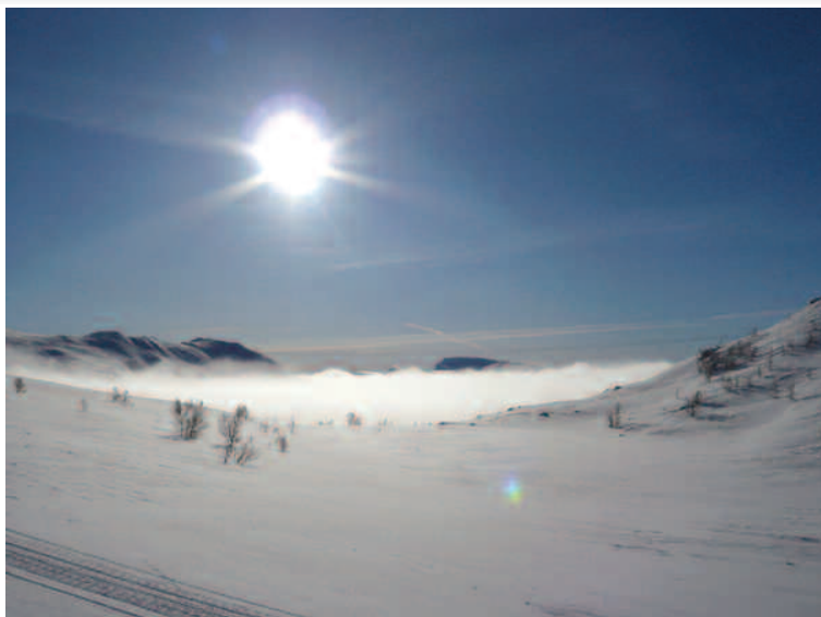
Et vidunderligt modlysbillede fra Tuxenløypen - blå himmel, men med tågeskyerne liggende i dalen - uge 7.

Vi savnede den hollandske kok, men den nye kok er sandelig også god og gavmild med de stærke krydderier. Her havde man glædet sig til aspargessuppen lørdag aften, det blev karrysuppe med fin og stærk smag. Således var der flere nyheder, alle smagt til med nye og spændende krydderier, og det giver en ekstra kokkehue til køkkenet.