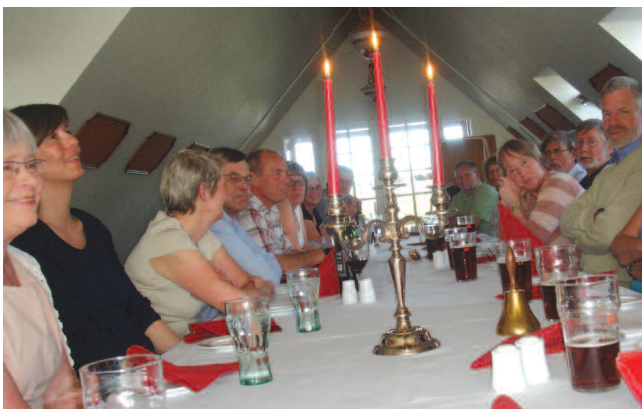
Stemmingsbillede fra Fregatbordet!

Hvad der var mere interessant var, at klubbens unge fremadstormende kasserer i sidste øjeblik også havde meldt afbud. Her måtte referenten spidse ører en ekstra gang og se lidt i sine no-