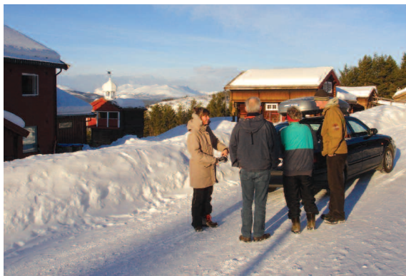
Farveller og luftige kram

En vis redakteur af et betydningsløst, men måske overset, tidsskrift, også en uge otter, havde fået en idé: Jeg skulle lave en reportage om livet, som det formede sig i uge 9 på Ruten. Det ville han gerne vide lidt om.