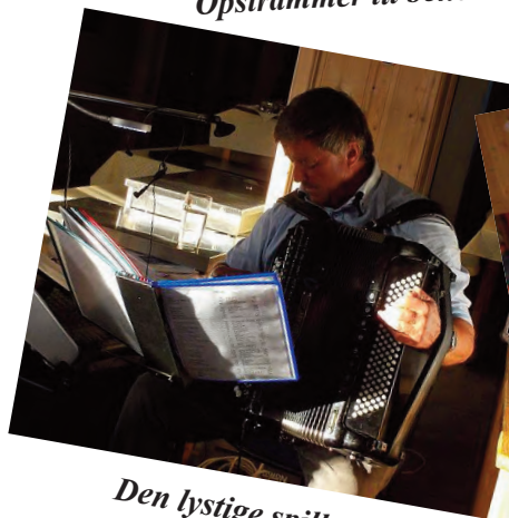
Den lystige spillemand