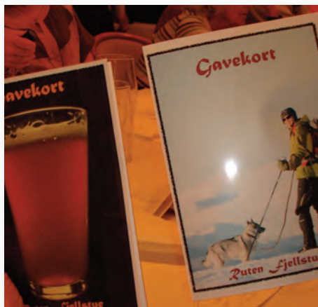
De flotte gavekort

Det var så det – en god og glad aften var slut, klokken var ved at være mange, og medlemmerne drog hver til sit til nære og fjerne destinationer.