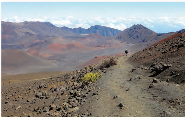
En dags 'hiking' i nationalparken Haleakalā på øen Maui - højt hævet over skyerne

magma op igennem pladen, og selv om pladens overflade i dag ligger flere kilometer under havets overflade, bryder dette materiale på et eller andet