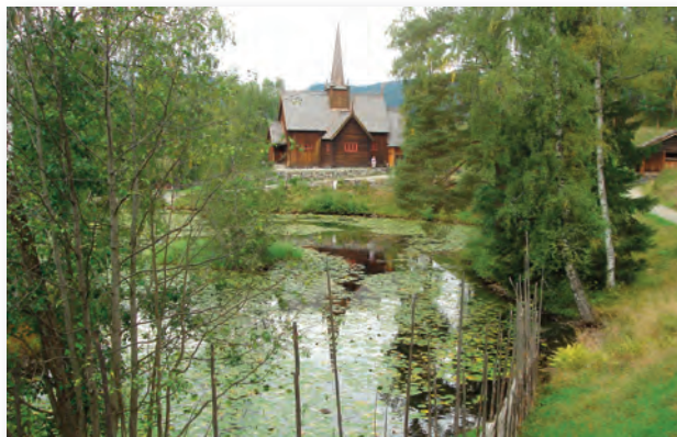
Indtryk fra Maihaugen