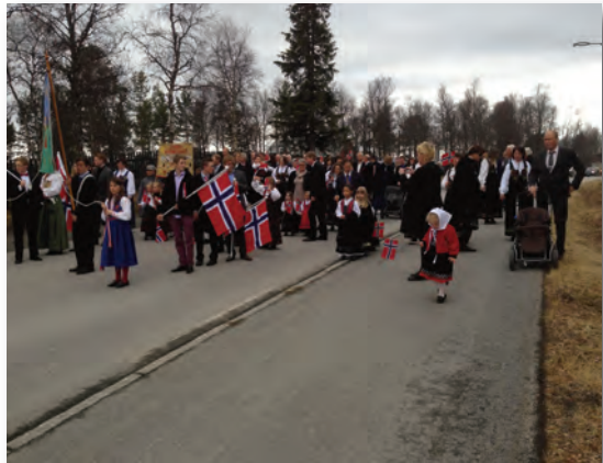
Sådan fejres 17. maj i Skåbu