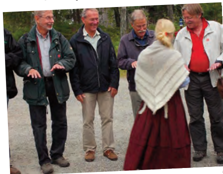
Negletjek i Maihaugen