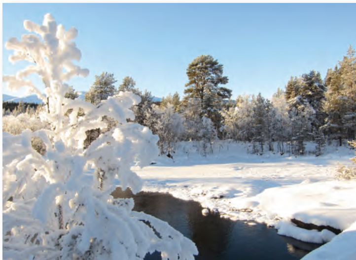
I vandstærrens iskolde rige i strålende sol

Mens mine mænd kunne hygge sig med computer, læsestof og hjemmebag, søgte jeg udenfor. Da jeg var ale-