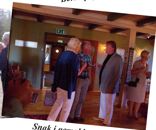
Snak i gemakkerne