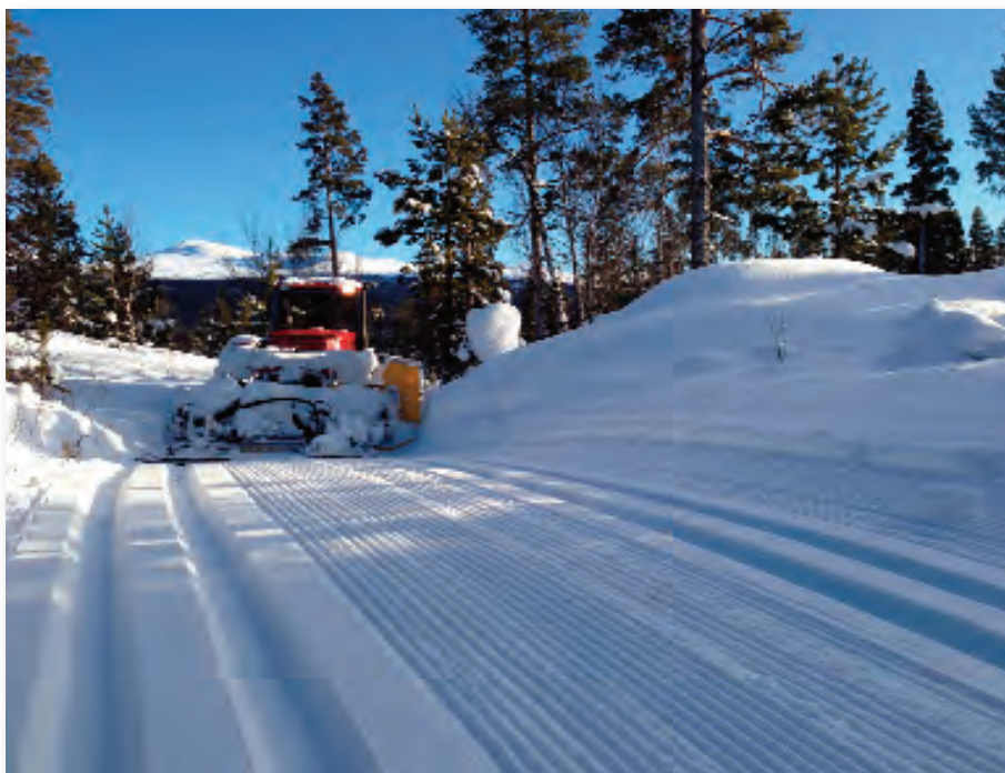
Løjpermaskinen på arbejde - indbydende ser sporet ud - lige klar til vinteren!