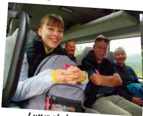
Lutter glade vandrere