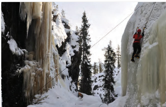
Isklatrning i iskolde Helvete i Espedalen

Men geologisk set findes efter sigende her det største antal kæmpejættegryder i Norge - og i Europa. Enkelte af jættegryderne er op til hele 100 m dybe og har en diameter på 40 m. Jættegryderne i Helvete er opstået, dengang vandet fra søerne i Espedalen løb mod syd. Hele landskabet er siden da vippet, så vandet nu løber mod nord. Jættegryderne er en slags 'borehuller'. Kæmpestore sten blev dengang ført med den rivende vandstrøm og neden for de utvivlsomt vilde vandfald 'låst fast' i strømhvirvlerne, som bragte dem i kraftig rotation, så de virkede som en slags boremaskine. Alt dette skete tilbage i istiden.