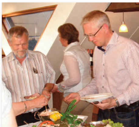
Buffet'en tages grundigt i øjesyn