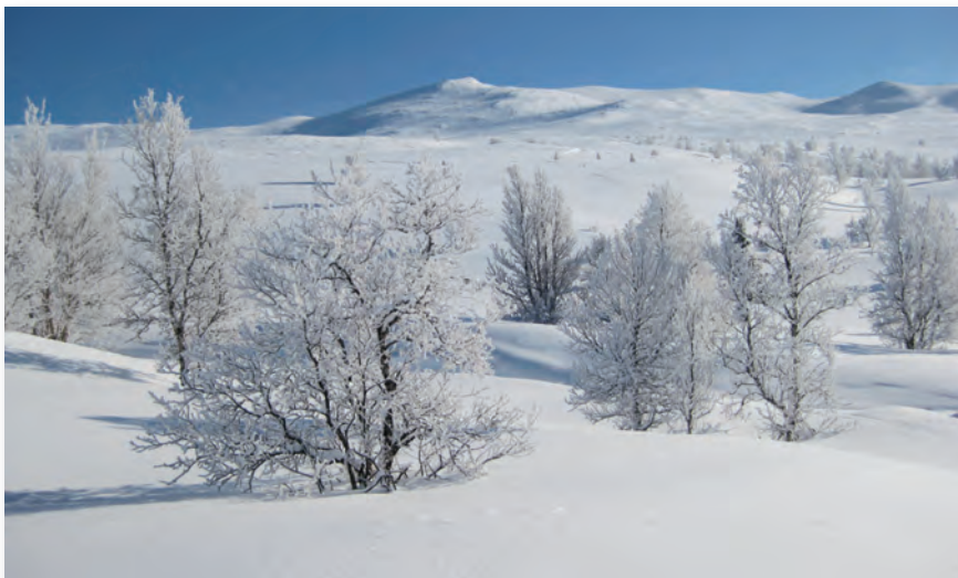
Blikretning mod Venli og på vej mod Svarttjønnholet - vistnok!