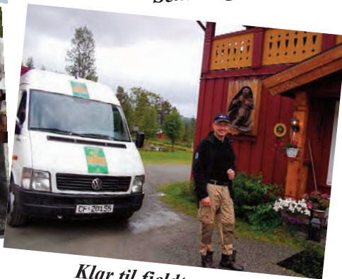
Klar til fjeldtur