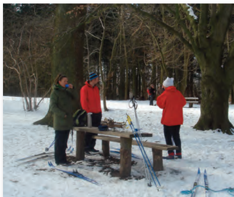
Herligt med en kop kaffe!

Selv om man godt kan stå på ski på Hawaii, var det ikke lige det, der stod på listen. Så sidst i uge 12 blev skiene alligevel fundet frem, og det blev til en herlig skitur i Hareskoven nord for København. Det smagte da altid lidt af langrend!