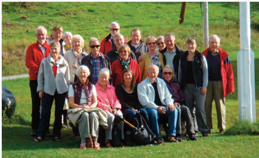
Det glade 45 års jubelhold på Ruten september 2013 Klar til hjemtur efter fantastiske dage!

S å kom dagen, den 28. august 2013. Forud var der i arrangementsudvalget gået en minutløs planlægning. 18 gode Ruten-venner var mødt op i afgangsterminalen til Oslo-båden og snakkede allerede muntert og højlydt. Én havde sågar taget ski med, selv om det vist ikke helt passede til årstiden. Afkrydsning på deltagerlisten, udlevering af kahytsskibe og derefter ombordstigning