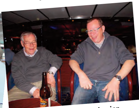
Senior og junior