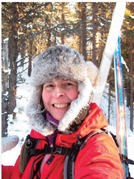
Isnende koldt selvportræt med varmt smil og skiene i rygsækken

På hjemmefronten går vi nu og planlægger næste års januarferie. Selvom det var hyggeligt at stå på egne ben (ski), er det altså hyggeligere, når resten af familien er med. Møbelben af stål er bandlyst i vores hjem. Det samme er langvarigt udearbejde i frostvejr.