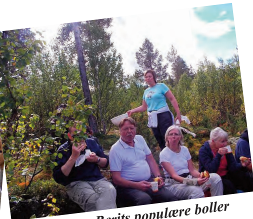
Berits populære boller