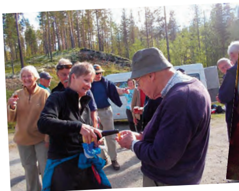
Opstrammer til benene