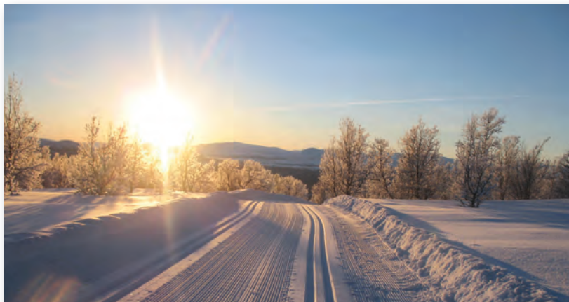
Stemmingsbillede fra uge 8

PS: Jeg har i dag mødt den flinke ski-træner i kantinen, han mindede mig om, at der er opstart lige efter nytår, - uha, der er ikke længe til, men skidt så er der jo heller ikke så lang tid til uge 8.