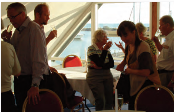
Hyggesnak på Fregatten

Vejret var rigtig sommerligt på denne første mandag i maj måned 2013. Dermed også tid til det traditionelle årsmøde i den nu 45 år gamle Ruten Skiklub. Atter i år var årsmødet henlagt til Restaurant Fregatten i Hundige Havn, ikke mindst fordi lokalele-