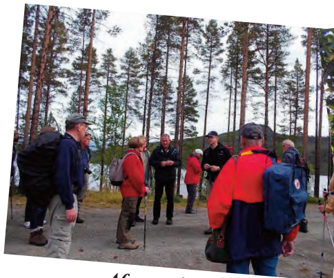
Afgang til Petsiko