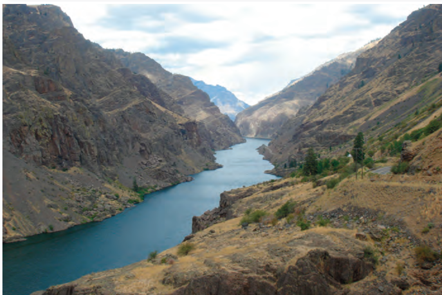
Snake River har i løbet af årmillionerne gnavet sig vej gennem Hells Canyon - Oregon til venstre, Idaho til højre

Og selv i Danmark nær ved Viborg ligger der på østsiden af Nørresø en 'Helvedesdal'. Efter sigende var det stedet, hvor rævene skyndsomst søgte tilflugt, hvis ikke jægerne fik ram på dem. De forsvandt så at sige "ad helvede til".