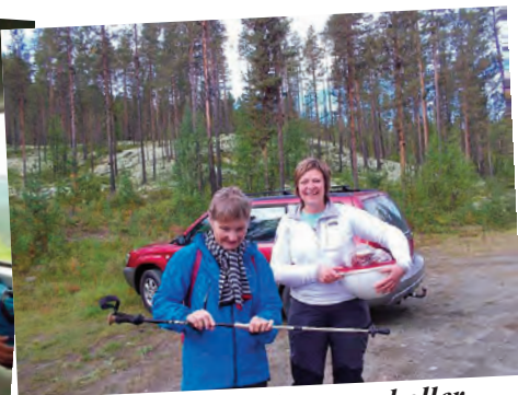
Damer med stav og boller