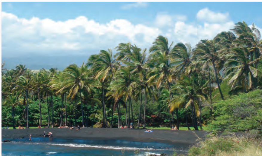
Black Sand Beach på Big Island - Blæst og sågar havskildpadder

Vi aflagde også besøg på toppen af den inaktive vulkan Mauna Kea ( Det Hvide Bjerg ) i 4.200 m højde og kunne her indendørs besigtige et af Keck-teleskoperne med dets 10 m spejl. Kyndige astronomer fortalte samtidig om de seneste astronomiske opdagelser. Afsindigt interessant! Vi så sørme også flere snow-board'ere på toppen, så sne oplevede vi i hvert fald i uge 9. Det blæste heftigt på toppen, og også her blev jeg klog af skade. Jeg havde ikke fået sokker på i mine åbne sandaler. Jeg fik derfor også lynhurtigt næsten dybfrosne tæer i blæsten og al sneen. Nå, men