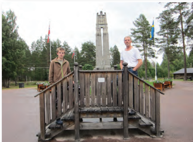
Et norsk-svensk grænsetilfælde

Norge i grønt er lige så fantastisk som Norge i hvidt. Vi oplevede samme temperaturer som i uge 3 og 4, denne gang bare med + foran, og vi var oven i købet så heldige, at solen skinnede næ- sten alle dage. Så kan man ikke forlange mere af en ferie. Vi fik set nogle af de steder, man ”skal” se og en masse andre steder, som vi til- fældigvis kom forbi. Vi