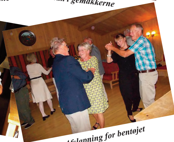
Afslapning for bentojet