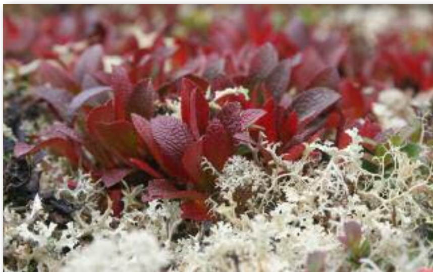
Fjeldfarver i september!