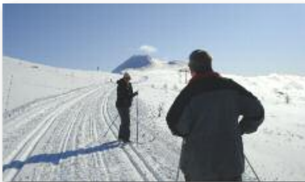
Tuxen ta'r Tuxen-løjpen!

Vi bookede hytten til uge 10 og ankom lørdag 3/3 til Ruten. Det tegnede fint, det var let frost og sol, men det var længe siden, der var faldet sne. Arthur var dog flittig til at køre sporene igen og igen, så løjperne var brugbare.