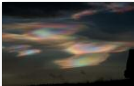
Perlemorskyer over Ruten i januar 2012

Skilæreren kom, og allerede her kunne jeg se, at den moderne pædagogik også har ramt Espedalen... For hele tiden skulle børnene lege. Man skulle gå baglæns på ski, kravle på ski, hoppe på ski osv. Børnene havde det kosteligt, ja, flere tissede vist i bukserne af grin. Forældrene var stolte, og bedsteforældrene syntes også det var fantastisk. Alt i alt var skiskolen en fantastisk mulighed for alle for at slippe det indre legebarn fri. Tak for det!