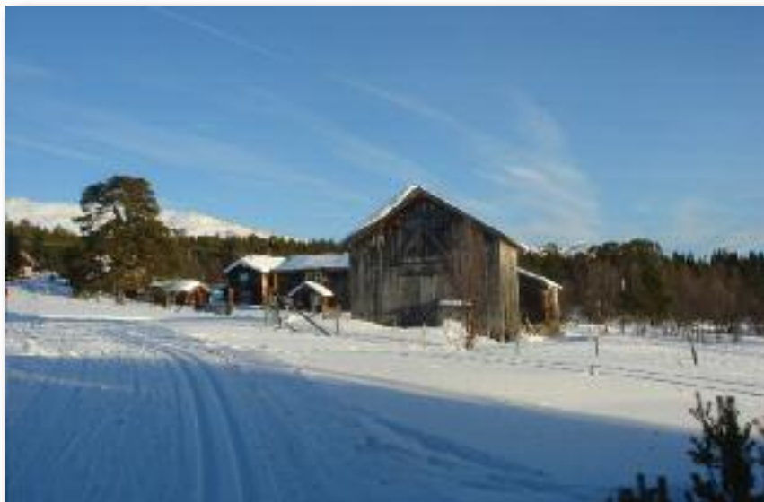
Øvre Dalseter i flot belysning