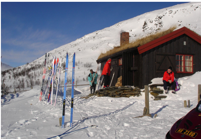
I Besøg ved Svarttjønnholet.

Fredagens tur til Svarttjønnholet var ganske enkelt en drømmetur. Høj sol, lidt frostgrader, næsten vindstille og varme pølser i hytten. Omvejen hjem via Tonebu og Fredrikseter skaffede de ekstra kilometer, som var nødvendige for, at vi også i år kunne gøre os fortjent til Norsk Skiforbunds guldnål (kan mod behørig dokumentation købes i receptionen).