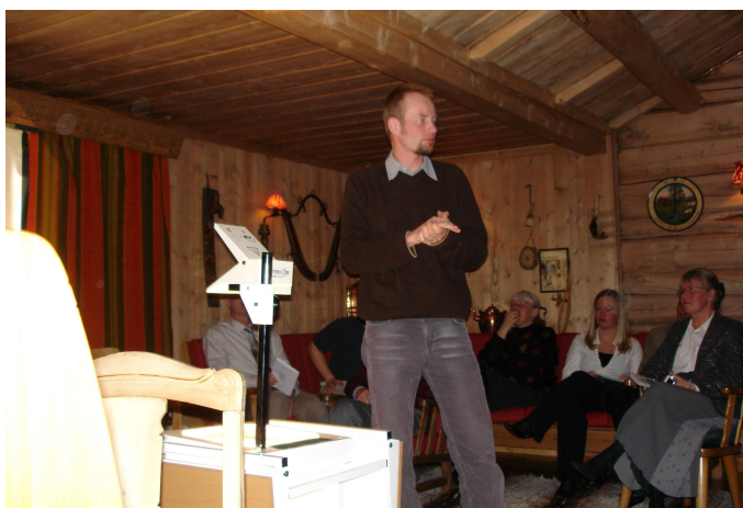
Sensationen – Danmark 10 cm højere!

Alle de velkendte ture blev løbet. Skiføret var til forskel fra 2004 ganske ufarligt og der blev derfor heldigvis ikke nogen gentagelse af forrige års dramatiske skadesfrekvens. Vejret viste sig stort set hele ugen fra sin allerbedste side. Et lille, men velkomment drøs sne blev det til tidligt på ugen.